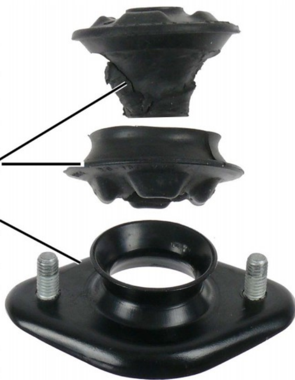
Рис. 2. Повреждённая верхняя опора амортизационной стойки