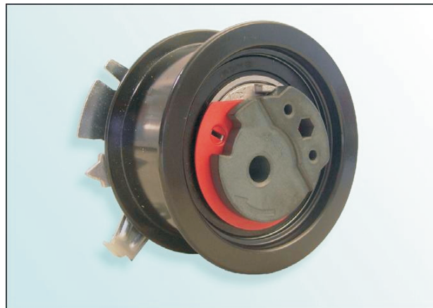
Рис. 1: 531 0628 30 (старая версия)

Эта техническая информация показывает визуальные характеристики «старой версии» и «новой версии».