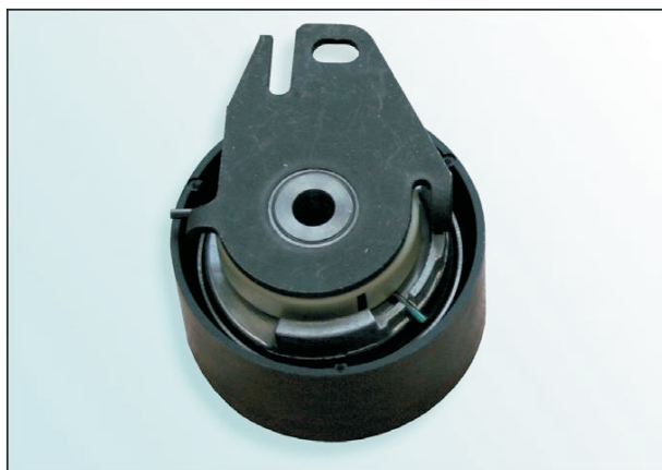
Рис. 1: OE-Тип

Оба типа натяжных роликов имеют одобрение заводов-изготовителей автомобилей.