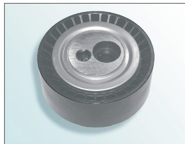
Рис. 2: Поверхность качения из пластика

В ходе постоянного развития нашей продукции, поверхность качения натяжного ролика 531 0148 10 была заменена с металла на пластик.